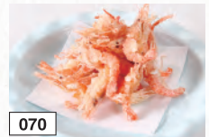
070 川エビの唐揚げ 455円(税込500円)