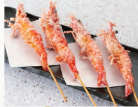
064 シュレットシメル ソフトシメル いただけます お召し上がり 殻ごと柔らかく 1本237円 (税込260円) (写真は4本です)