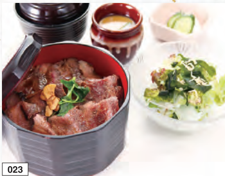
023 ステーキ重御膳 1,991円(税込2,190円)