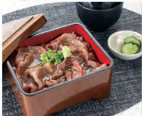
026 極上国産牛炙り重 2,200円 (税込2,420円)