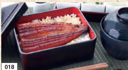
018 うな重 (お吸い物付き) 1,991円 (税込2,190円)