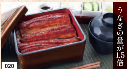
020 上うな重 (お吸い物付き) 2,637円 (税込2,900円)