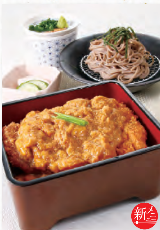
121 新 かつ重と そばセット