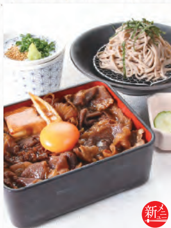
120 新 月見すき焼き重と そばセット