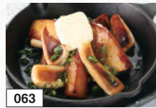
063 イカジャガバター 682円(税込750円)