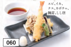
060 天ぷら盛り合わせ 691円(税込760円) エビ、イカ、ナス、カボチャ、舞茸、しし唐