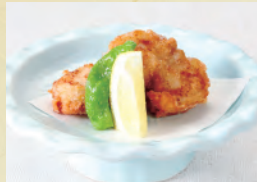
114 とらふぐの唐揚げ 1,500円(税込1,650円)