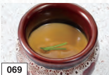
069 茶碗蒸し 391円(税込430円)