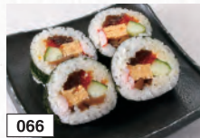
066 昔ながらの太巻ハーフ 800円(税込880円)