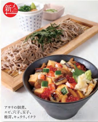
アサリの佃煮、 エビ、穴子、玉子、 椎茸、キュウリ、イクラ