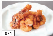
071 タコの唐揚げ 491円(税込540円)