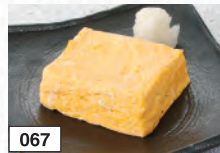
067 自家製玉子焼き 428円(税込470円)