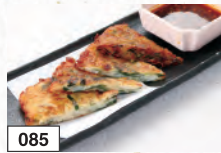
085 さくもちっニラチヂミ 782円(税込860円)