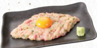
031 漁師のなめろう 700円(税込770円)