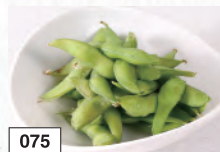
075 枝豆 382円(税込420円)