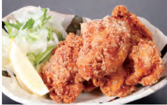
087 大きな鳥の唐揚げ【5個】 700円(税込770円) 088 大きな鳥の唐揚げ【3個】 455円(税込500円)