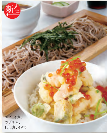
エビ、イカ、 カボチャ、 しし唐、イクラ