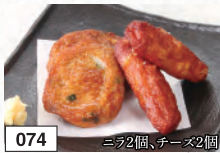
074 ニラ2個、チーズ2個 人気のおつま揚げ 782円(税込860円)