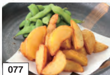
077 おつまみセット 582円(税込640円)