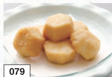
079 ホクホクから 391円(税込430円)