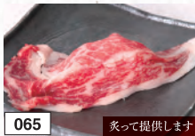
065 炙って提供します 極上国産牛炙り寿司 582円(税込640円)