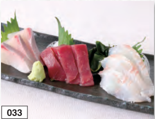
033 おすすめ刺身盛り(小)