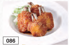
086 鳥手羽甘辛揚げ 800円(税込880円)