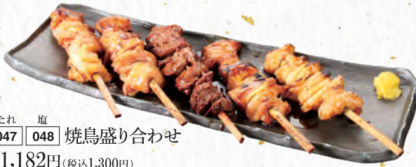
たれ 塩 047 048 焼鳥盛り合わせ 各1,182円(税込1,300円)