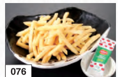
076 ポテトフライ 446円(税込490円)