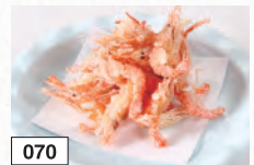
070 川エビの唐揚げ 455円(税込500円)