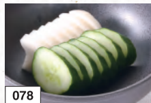
078 お新香盛り合わせ 364円(税込400円)