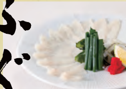
112 とらふぐ刺し 2,000円(税込2,200円)