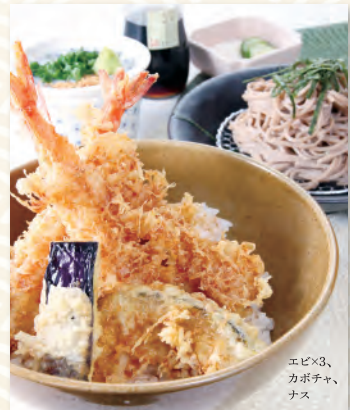
エビ×3、 カボチャ、 ナス